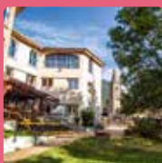
LE RUBONS Saint-Etienne-de-Tinée

Le village Ternélia Henri IV fait partie d'un groupement d'associations qui vous propose des séjours sur les sites suivants :