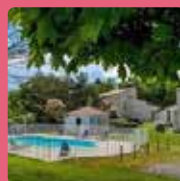
HENRI IV Clisson