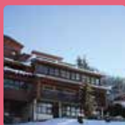
LES FLOCONS VERTS Les Carroz d'Arâches