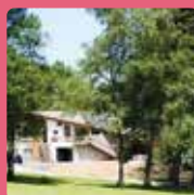
LE PRÉ DU LAC Saint-Jorioz