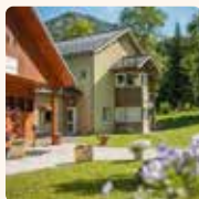
L'EAU VIVE Lescheraines