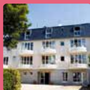
LES RÉSIDENCES D'ARMOR Douarnenez