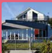
LE VENT DU LARGE Saint-Gilles-Croix-de-Vie