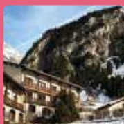
LE TÉLÉMARK Pralognan-La-Vanoise